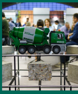
Fotografija s naslovnice: Nastup na 48. Međunarodnom sajmu građevinarstva u Beogradu