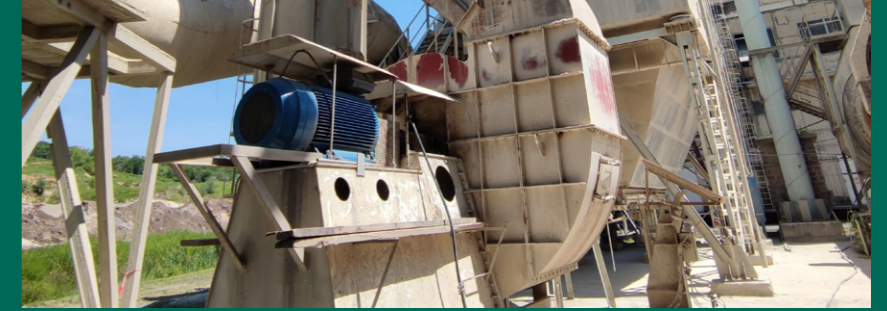
Ventilator filtera sušare sirovine - prije radova