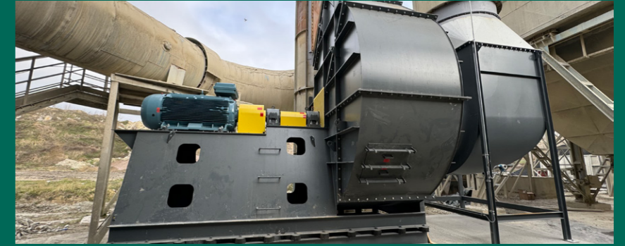
Ventilator filtera sušare sirovine - poslije radova

Tako je i u tvornici cementa NEXE nedavno završen najveći opseg aktivnosti, remont linije za proizvodnju klinkera koji je trajao od 05.02.2024. do 17.03.2024. godine, a prvi proizvodni dan bio je 19.03.2024. Međutim, remontne aktivnosti započele su već u studenom 2023. godine na mlinovima cementa. U studenom su tako uspješno odrađene planirane aktivnosti na mlinu cementa I, u prosincu na liniji pakiranja I, a krajem 2023. godine i početkom 2024. u fokusu su bili zajednički objekti mlinova cementa, sušara dotada i portalna dizalica. S početkom 2024., remontne aktivnosti „preselile“ su se na liniju pakiranja II, središnji dio – liniju za proizvodnju klinkera, a odmah po završetku ovog dijela, uspješno je odrađen i remont mlina cementa III koji je završen 26.04.2024.