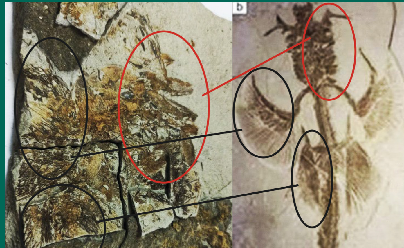
Fotografija a) fosilni nalaz